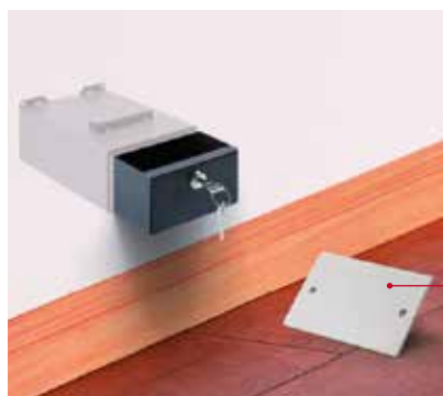
Cassaforte a 1 cassetto posizionabile in una scatola porta frutto elettrico

Coperchietto magnetico incluso nella confezione