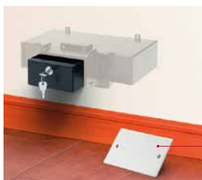
Cassaforte a 3 cassette posizionabile in una scatola porta frutto elettrico

Coperchietto magnetico incluso nella confezione